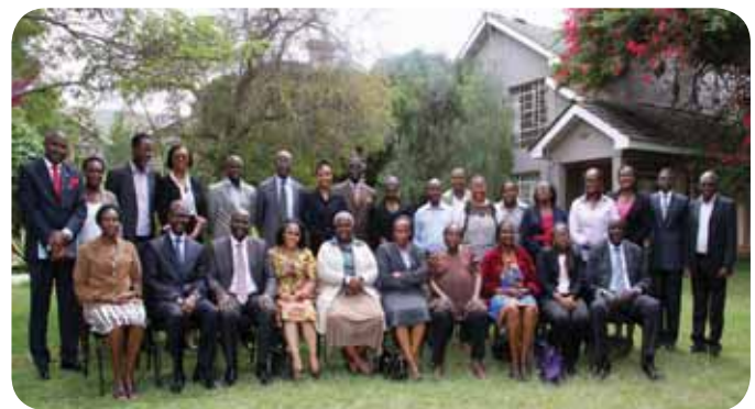
Participants during the induction retreat of new commissioners held at the Lukenya Getaway on May 5th 2014.

The appointment of new Commissioners at the Kenya National Commission on Human Rights (KNCHR) was a result of intense efforts by key stakeholders including NANHRI who lobbied the Government of Kenya through various concerned agencies to prioritize and expedite the process of appointing Commissioners.