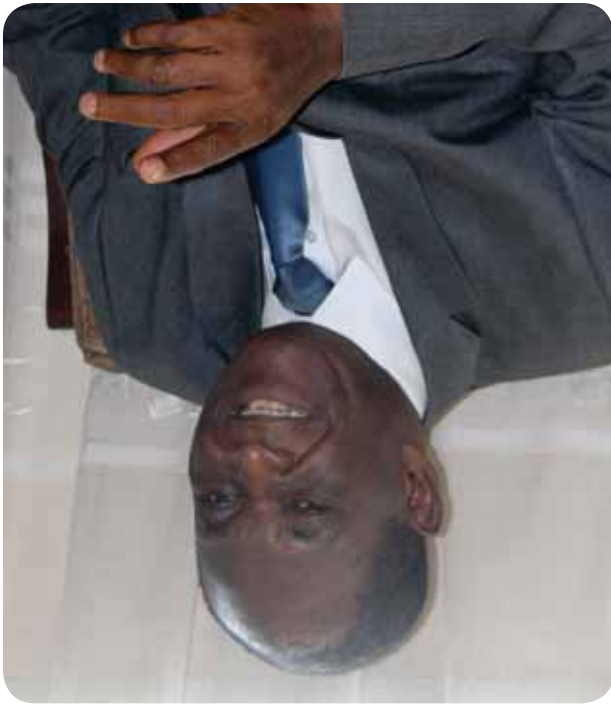
Plan stratégique 2015-2019.

La séance de planification stratégique a également offert au Comité directeur l'occasion de débattre de son rôle éventuel, en termes de gouvernance, de leadership et de mobilisation des ressources au cours des cinq prochaines années, afin de garantir une finalisation satisfaisante du plan stratégique 2015-2019.