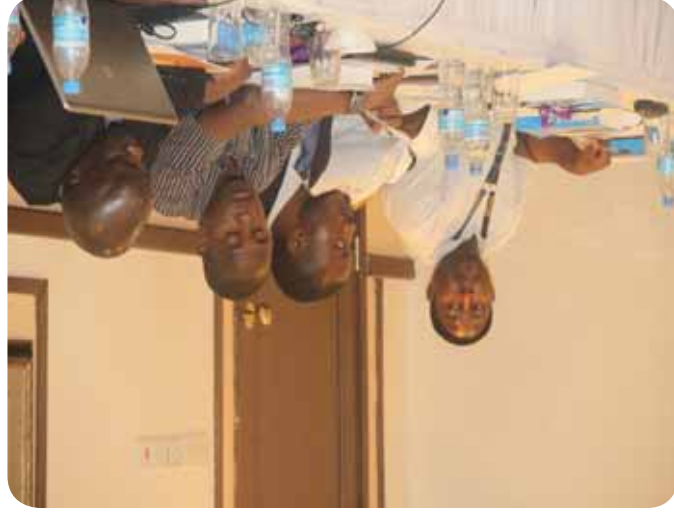
Participants suivant une communication au cours de la formation

Les participants ont acquis des connaissances et une compréhension essentielles (du droit) international des droits de l'homme, notamment des principaux instruments des droits de l'homme et des rôles et fonctions fondamentaux des INDH. Le séminaire s'est intéressé au rôle des INDH dans la prise en charge de différents domaines : entreprises et droits