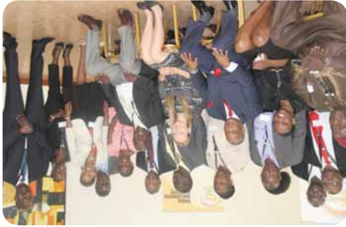
Participants au séminaire à Kampala, en Ouganda

Le processus est toujours en cours et il est envisagé qu'en 2015, le guide de suivi sera distribué aux INDH, en vue d'être testé avant sa finalisation et sa validation par les INDH africaines. Ce processus a produit un résultat digne de retenir l'attention, il s'agit du fait que la Commission des droits de l'homme de Zambie s'est engagée, après le séminaire de Kampala, dans la création d'un instrument de suivi pour contrôler le respect des droits des personnes handicapées dans les lieux de détention. Il s'agit là d'un résultat positif qu'il conviendrait d'encourager et de saluer.