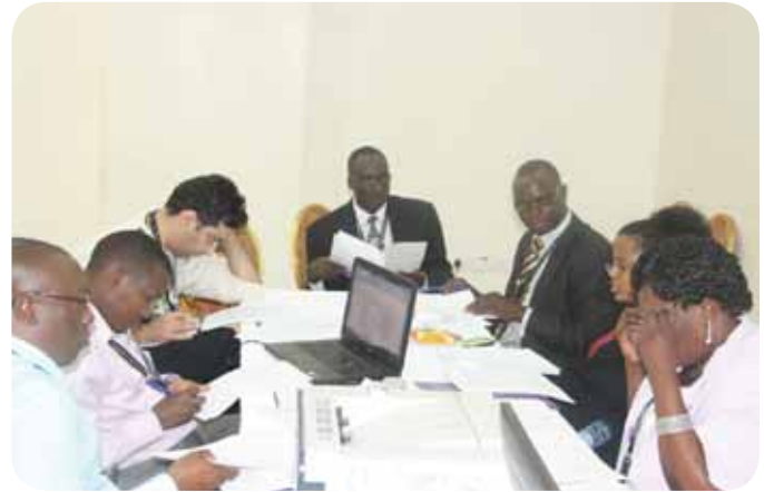
Participants at the workshop

working on the rights of persons with disabilities could discourse together, identify problems and offer practical solutions towards effective monitoring. Most importantly, the workshop tested and attempted to further refine a draft 'Article 33 Monitoring guide' that is currently being developed and shall be finalised for onward use by all African NHRIs in 2015.