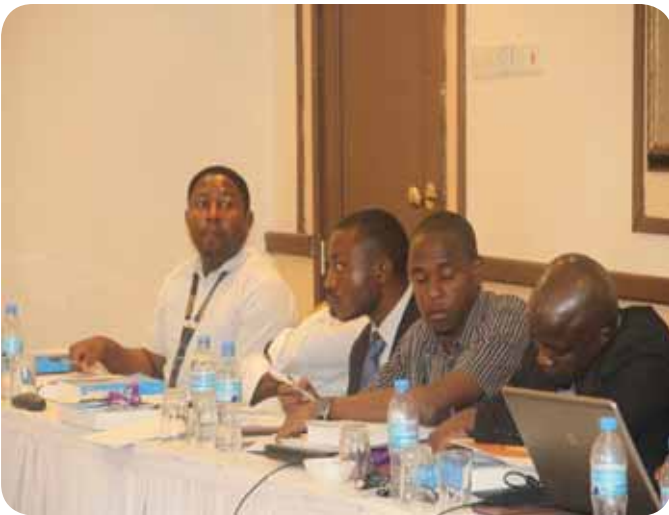
Participants following a presentation during the training

Participants gained critical knowledge and understanding of international human rights law including the key human rights instruments, the African Human Rights Systems and the core roles and functions of NHRIs. The workshop focused on the role of NHRIs in dealing with specific thematic areas; business and human rights, peace and conflict,