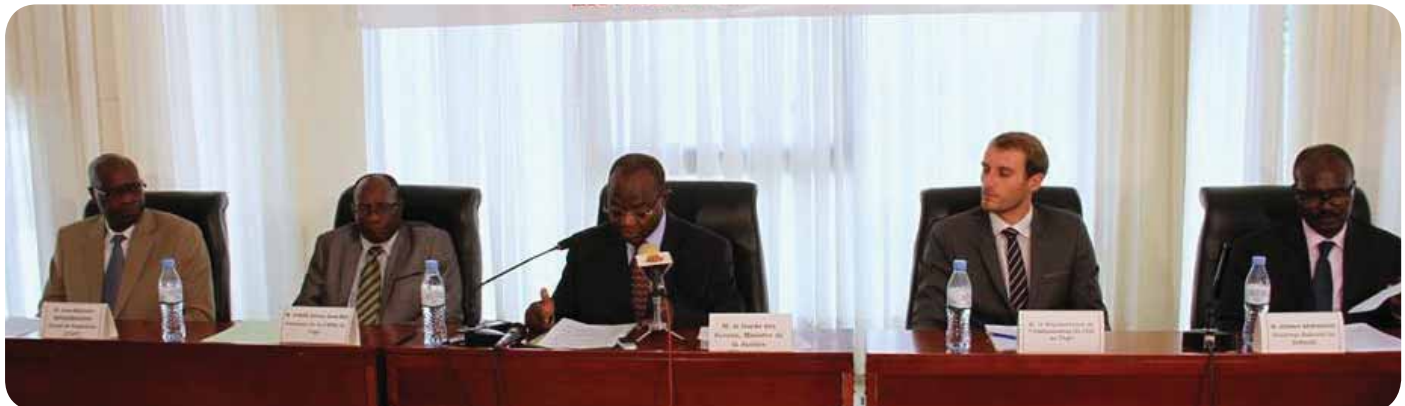
A Participant facilitating during the workshop

The fourth activity under the project was the learning incubator training for Public Officials in Prevention of Torture that was held in Yaoundé Cameroon. The main objective of this training was to enhance the capacity of the African NHRIs to identify the training needs of law enforcement personnel with regards to torture prevention and to develop institutional strategies to better