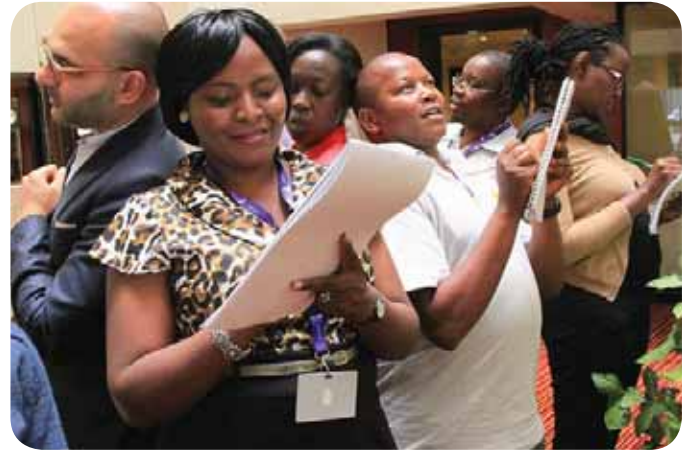
Participants at a session during the workshop.

training workshops within their institution for their colleagues thus responding to the initial objective of building the capacity of African NHRIs to develop in-house training programmes.