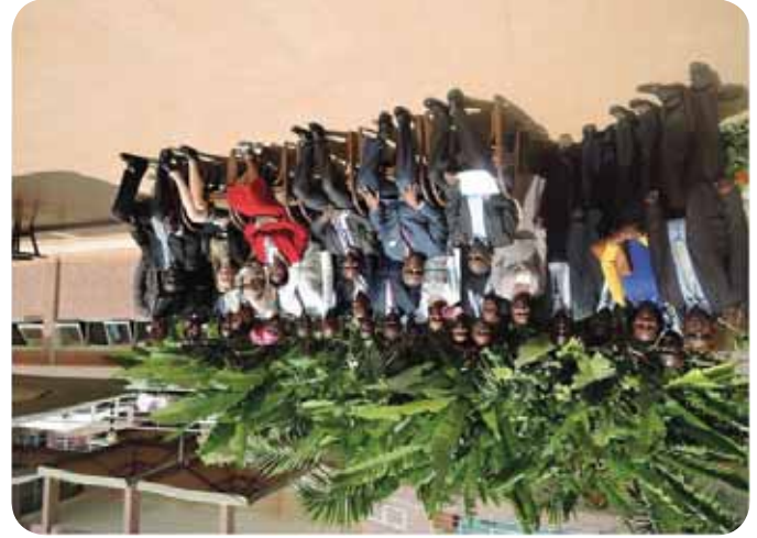
Participants au séminaire de renforcement des capacités sur la gestion et le règlement des conflits, la consolidation de la paix, Kigali, Rwanda

Comme indiqué ci-dessus, l'Observation générale N°2 appelle les Etats Parties à la Convention sur les Droits de l'Enfant (CDE) à veiller à ce que leurs INDH jouent un rôle significatif dans la supervision des droits des enfants. Plusieurs INDH ont mis en place, au sein de leurs structures opérationnelles, des unités d'évaluation humanitaire de développement qui s'occupe des droits des enfants. Avant le forum,