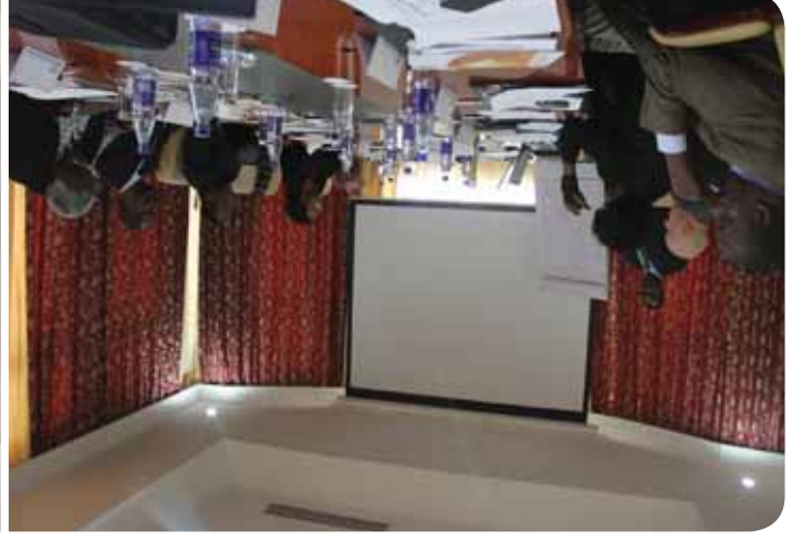
Membres du Comité directeur au cours de la séance de planification stratégique de Nairobi, Kenya.