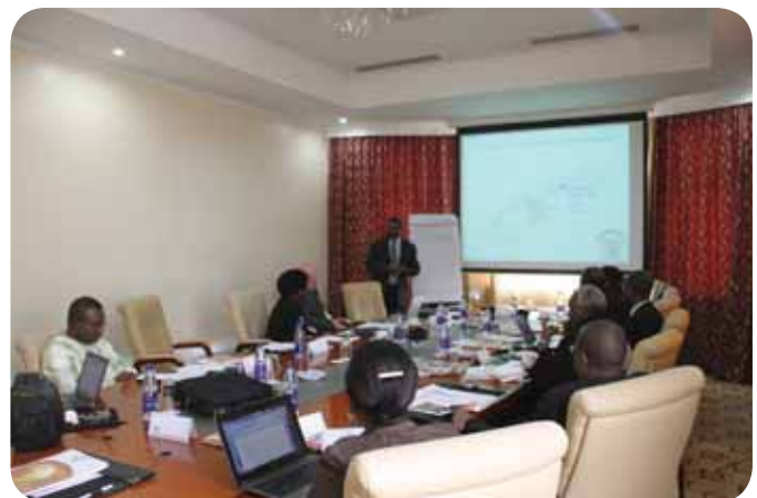
Members of the Steering Committee during the strategic planning session in Nairobi, Kenya

The session served as a platform for evaluating the feedback received from the various stakeholders as well as a platform for deliberating on the