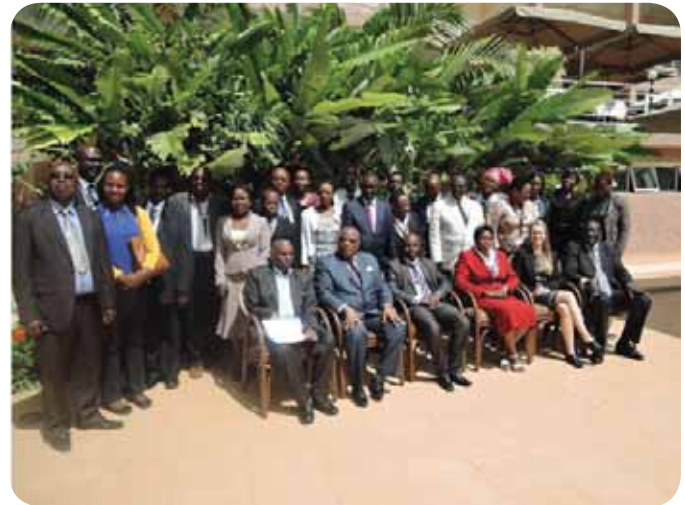
Participants at the capacity building workshop on conflict management, resolution and peace building, Kigali, Rwanda.

In light of the upcoming general elections in all the EAC countries; starting with Burundi and Tanzania in 2015; Uganda in 2016; Rwanda and Kenya in 2017, the EAC NHRIs expressed an urgent need for "Conducting trainings for EAC NHRIs and key stakeholders on the fundamentals of elections in peace processes and on election standards". This has been earmarked as one of the activities to be implemented in 2015.