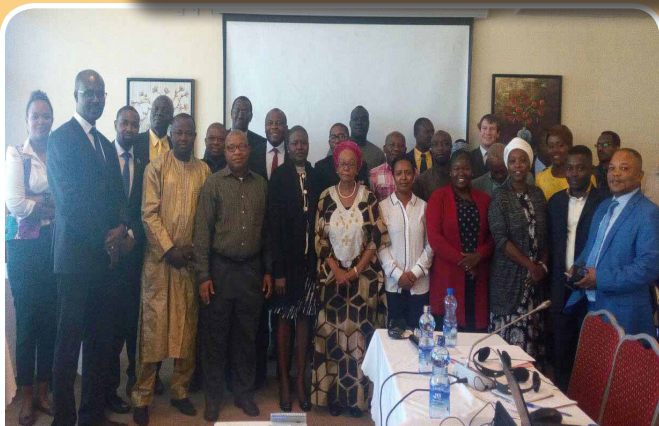
A family photo the NHRIs Litigation Capacity Gaps and Online information Centre reports validation meeting on November 22, 2018. Secretariat.