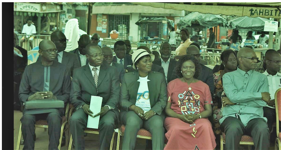
Photo prise au cours de la cérémonie des 70 ans de la DUDH (Madame la Présidente de la CNDHCI, l'ex Première Dame de la Côte d'Ivoire et des Représentants du Système des Nations Unies.

La Côte d'Ivoire, à l'instar des pays du monde entier, a célébré le 70ème anniversaire de la Déclaration Universelle des Droits de l'Homme (DUDH), le lundi 10 décembre, à la place Ficgayo de Yopougon, en présence de l'ex- première Dame, Simone EHIVET GBAGBO, à l'initiative de la Commission Nationale des Droits de l'Homme de Côte d'Ivoire (CNDHCI).