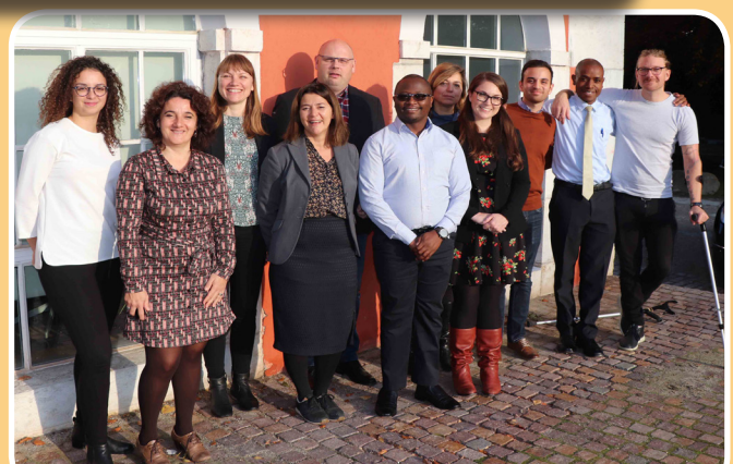
Technical staff of the GANHRI's regional networks take part in FUSE workshop on November 5-6, 2018. The workshop discussed establishment of online knowledge management to enhance information sharing among the members of the networks.