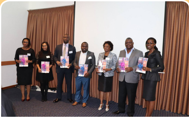
NANHRI launches Decriminalisation of Petty Offences Baseline Assessment Report on October 3, 2018 in Accra, Ghana.