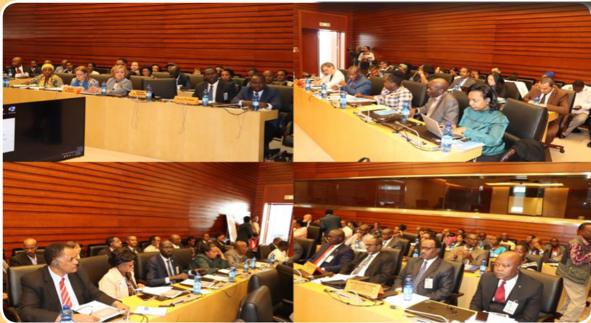
A combined photo of participants of the NANHRI Second Policy Forum held from November 23-24, 2018 in Addis Ababa Ethiopia. The Forum discussed the role of NHRIs in preventing and combating corruption.