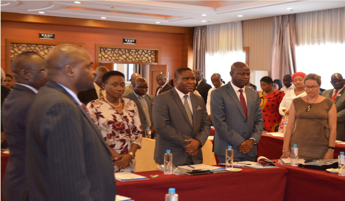
Participants of the peace-building conference observe a minute of silence for victims of past violence in Malawi.