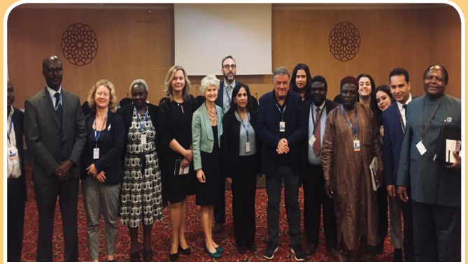
NANHRI members in the Working Group on Migration meet partners for a roundtable meeting in Marrakech, Morocco, on December 9, 2018. NANHRI presented a Case for Support detailing actions for supporting the implementation of the Global Compact on Safe, Orderly and Regular Migration.