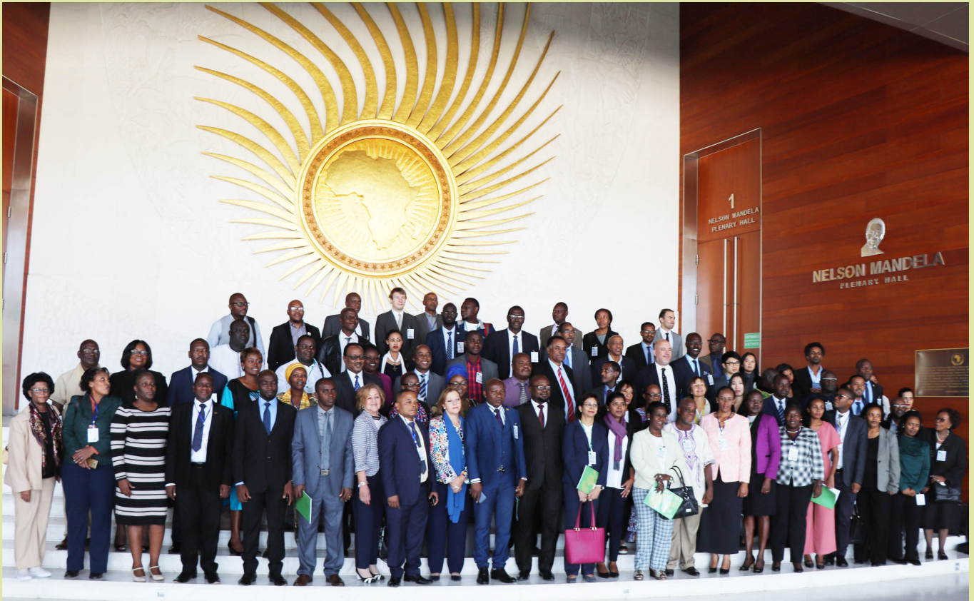
Participants of the NANHRI Second Policy Forum in Addis Ababa, Ethiopia, held from November 23-24, 2018. The meeting discussed the role of NHRIs in preventing and combating corruption.