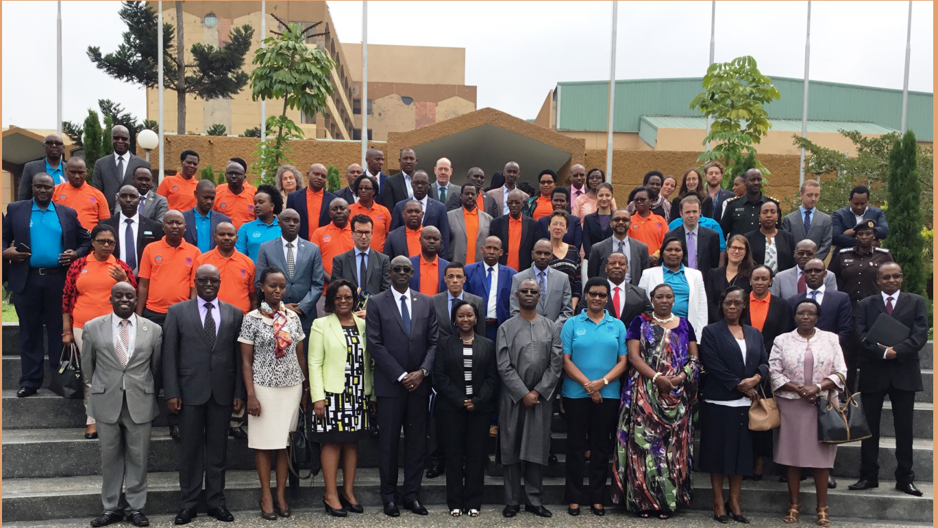
A family photo of the participants of the 70 th Anniversary of the UDHR in Rwanda. Ministers, legislators, were among those who attended the high-level conference organised by the NCHR.