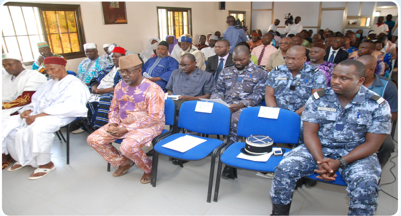
Les agents de sécurité rejoignent l'INDH du Togolaise a l'occasion du 69e anniversaire de la Déclaration Universelle des droits de l'homme

un texte d'une portée internationale inestimable qui établit l'égalité en dignité et en valeur de tous les êtres humains. Pour cet anniversaire, la CNDH a mobilisé autorités administratives, traditionnelles et religieuses, forces de l'ordre et de sécurité, représentants des partis politiques, leaders d'opinion, organisations de la société civile, médias, syndicats de conducteurs autos et motos, groupements de femmes et de jeunes, responsables des établissements scolaires, apprenants, et autres. Deux (02) jours d'activités pour échanger avec la population sur plusieurs thèmes, entre autres, « La liberté de réunion et de manifestation pacifiques publiques au Togo » et « La CNDH comme MNP : défis et perspectives ». Ces communications, très appréciées par les participants, ont été précédées du lancement officiel de la campagne visant à célébrer l'année prochaine le 70e anniversaire de la DUDH, une campagne qui s'inscrit dans la continuité de l'appel « Défendez les droits de quelqu'un aujourd'hui ! ». L'occasion pour le Président CISSE d'inviter tout le monde à s'engager dans le combat permanent de promotion, de protection et de défense de tous les