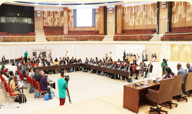
NANHRI General Assembly at Kigali International Convention Centre in Rwanda ahead of the Biennial Conference.