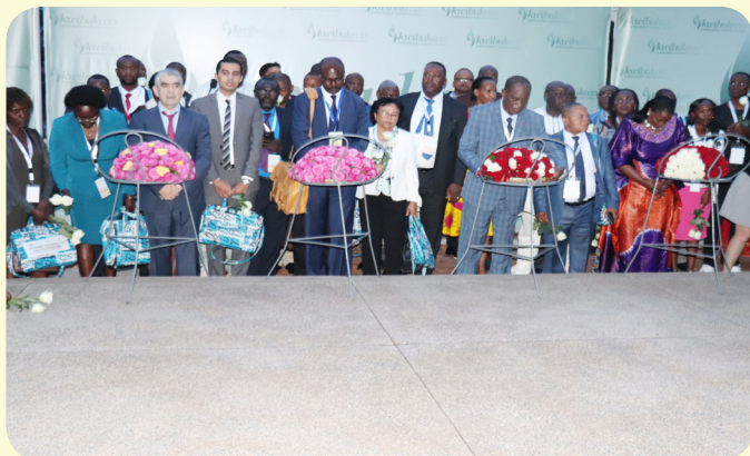
NANRI General Assembly members lay a wreath on a mass grave at the Kigali Genocide Memorial.