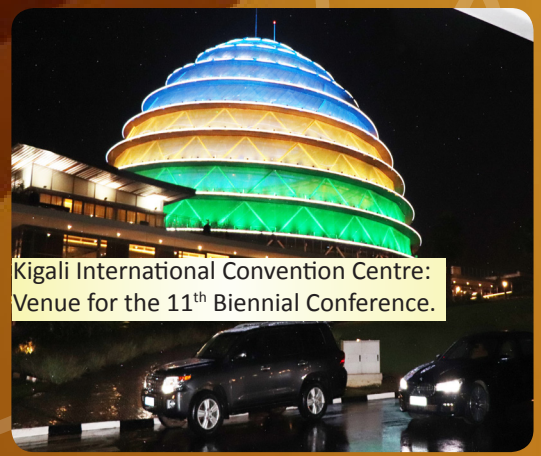
Kigali International Convention Centre: Venue for the 11 th Biennial Conference.