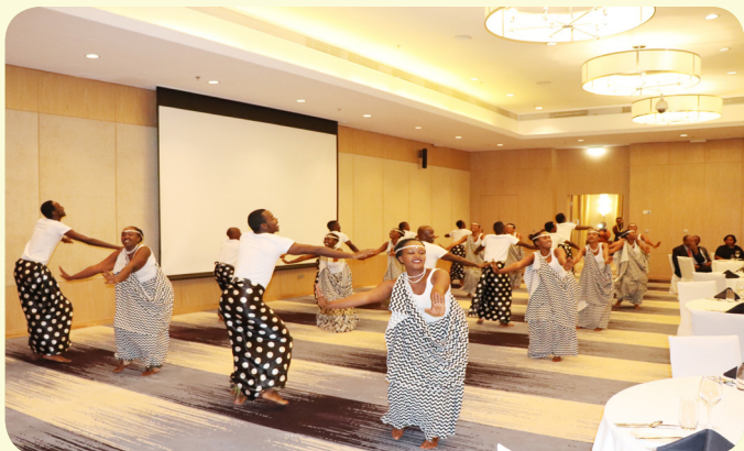
Ingazo Ngari dancers entertain guests during the 10 th Anniversary at Marriott Hotel, Kigali, Rwanda.