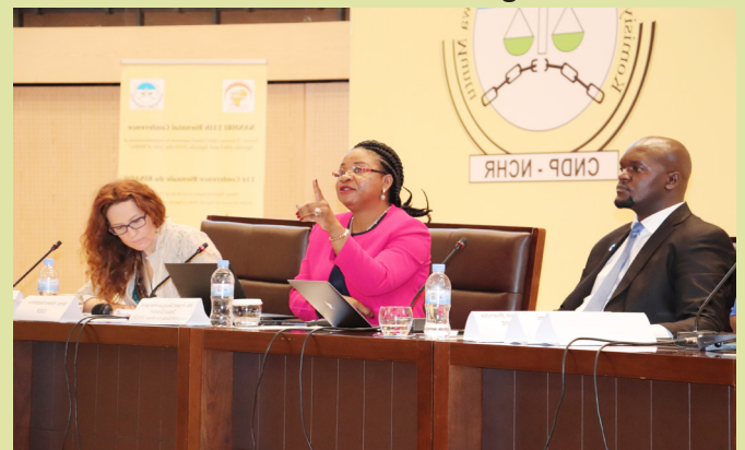
Discussions on the importance of data in realisation of sustainable development during the 11th Biennial conference.

The individuals in the Group will comprise representatives of NHRIs with expertise in research, training, legal and policy analysis and advocacy to provide technical input in the development and presentation of position papers and capacity strengthening of member NHRIs in the implementation of the 2030 and 2063 agendas for sustainable development. The Group will develop and strengthen a systematic, and sustainable approach among African NHRIs in sharing of experiences, good practices and knowledge management with and among NHRIs, civil society, governments and other stakeholders on implementation of the two agendas. The overall aim is consolidating a position of the African National Human Rights Institutions to effectively drive the discourse at the national, regional and international level. The members will draft and review terms of reference for adoption in the 2018 General Assembly in Geneva extraordinary session. Ordinary sessions are held just before a biennial conference. Besides the SGD, other working groups for the persons with disability, business and human rights, and migration were also formed and some NHRIs volunteered to come up with terms of reference for sharing with other members. The working groups were selected to give more impetus to the work of NHRIs in managing emerging issues like migration as well as fostering the commitment to solutions in 'neglected' themes.