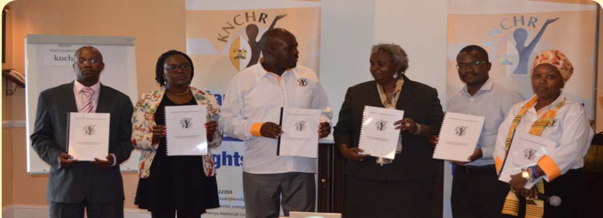
La présidente de la KNCHR, Kagwiria Mbogori (troisième à droite) et le vice-président (quatrième à droite) ont conduit d'autres agents à présenter le rapport des élections aux médias dans un hôtel de Nairobi. Plus de 270 personnes souffrent selon le rapport.