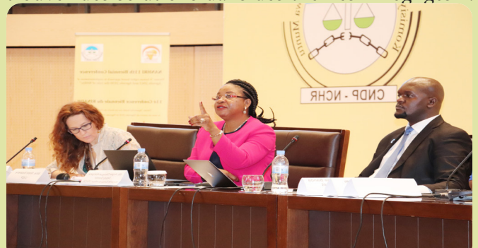
Discutant sur l'importance des données dans la réalisation du développement durable lors de la 11 ème conférence biennale.