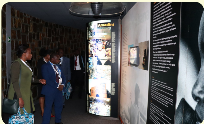
NANHRI members visit the Kigali Genocide Memorial on November 7, 2017. The tour foreran the 11 th Biennial Conference.