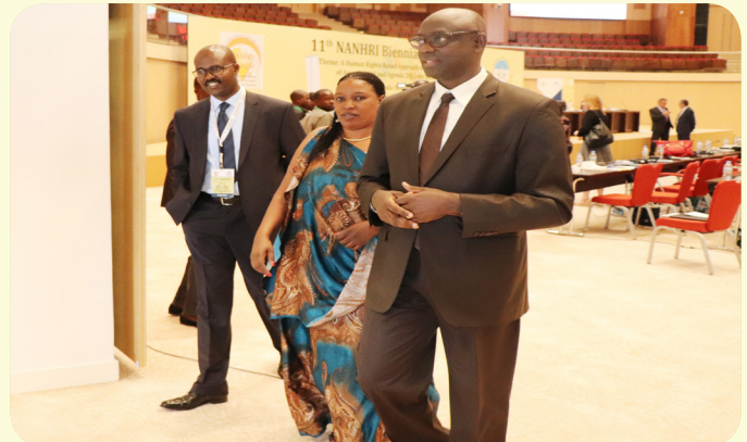
NANHRI ED Gilbert Sebihogo (far left) and Chairperson Madeline Nirere escort Rwanda Minister for Justice Johnson Bisingye out of KICC during the Biennial Conference. The Minister opened the Conference.