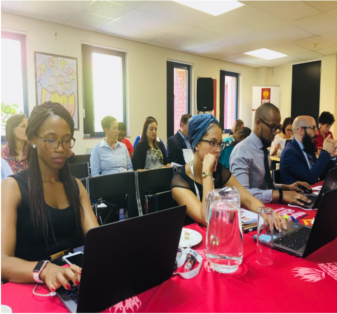
Participants in the mental health solution seeking forum organised by the South African Human Rights Commission.