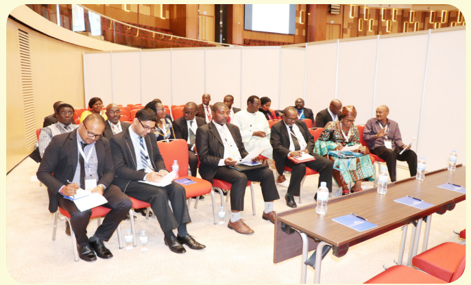
NANHRI Biennial Conference breaks for group discussions on working groups/NANHRI