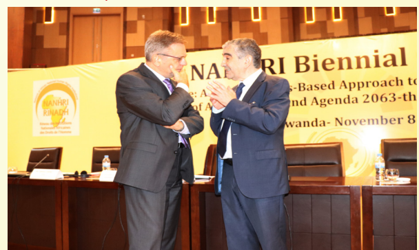
Mr. Vladelen Stefanov listens to CNDH, Morocco, Chairperson Driss El Yazami on the sidelines of the NANHRI 11th Biennial Conference.

On the margin of this assembly, a congress was Organized on “The role of NHRIs in promoting and protecting the rights of migrant people. “During this meeting, CNDH shared its migration experience, including its report “Foreigners and Human Rights” (2013), following which a new migration policy and regularization operations were put in place. Mr. Driss El Yazami welcomed the progress made on migration in Morocco, while stressing the importance of adopting global standards, approaches and solutions in the context of the Global Compact on Migration, which will be adopted by 2018 on one hand, and the reinforcement of African cooperation on these themes on the other.