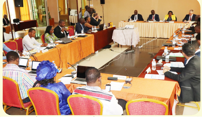
Association for the Prevention of Torture side activity in Kigali, Rwanda, ahead of the NANHRI 11 th Biennial Conference in November.