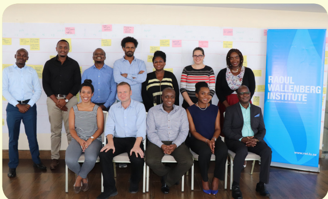
Raoul Wallenberg Institute of Human Rights and Humanitarian Law (RWI) projects workshop participants in at a Nairobi, Kenya. Various activities and timelines for implementations were discussed.