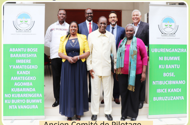
Ancien Comité de Pilotage

C'est le deuxième organe du Réseau après l'Assemblée générale.