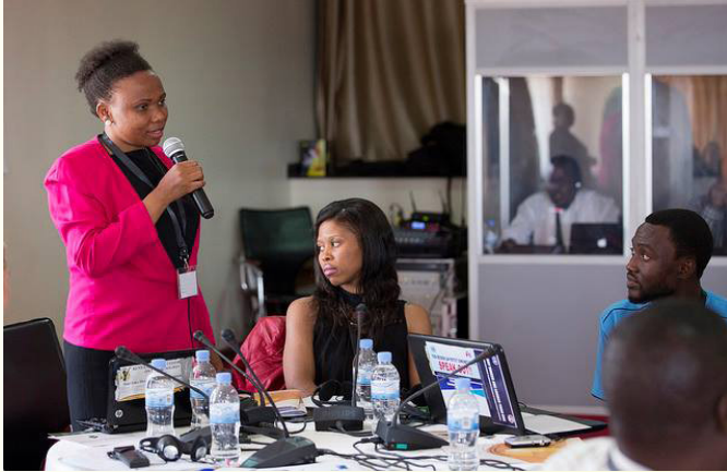
Un participant contribue au cours en face-à-face sur l'éducation aux droits de l'homme à Kigali, au Rwanda.