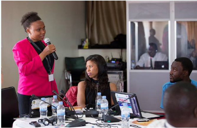
A participant contributes during the Human Rights Education face-to-face course in Kigali, Rwanda.