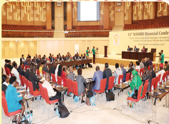
Participants à la 11e Conférence biennale du RINADH au Rwanda. Le Maroc accueillera la Conférence triennale du GANHRI en 2018.