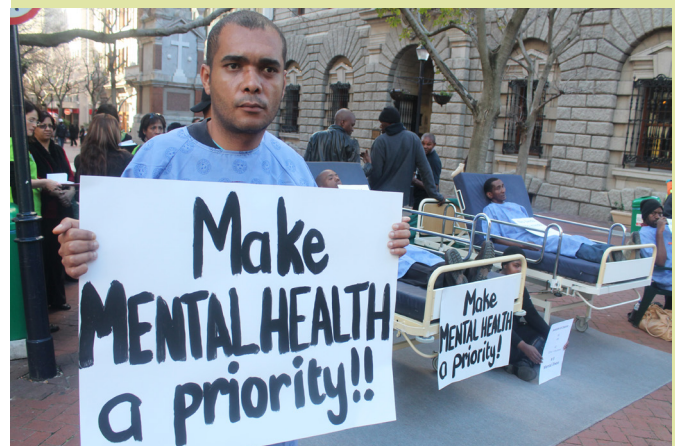
Advocating for increased attention into mental health in South Africa.

An indirect benefit of the hearing was to, among others, develop research and educational materials to advance the rights of mental health care users as a vulnerable group, for use by affected persons and stakeholders.