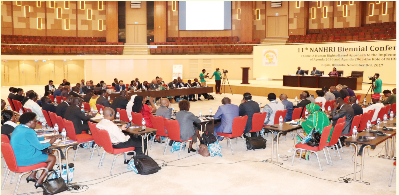
Participants at the NANHRI 11 th Biennial Conference in Rwanda. Morocco will host GANHRI Triennial Conference in 2018.