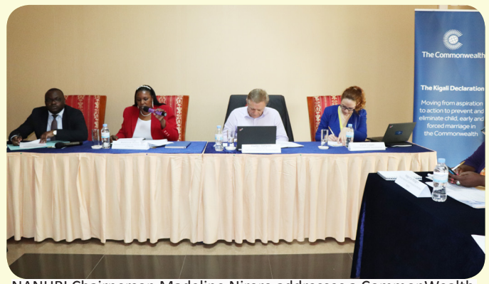
NANHRI Chairperson Madeline Nirere addresses a Commonwealth meeting on criminalising early child marriage after the Biennial Conference.