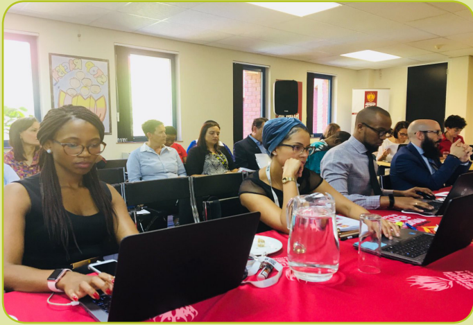
Les participants à la solution de santé mentale cherchant un forum organisé par la Commission sud-africaine des droits de l'homme.