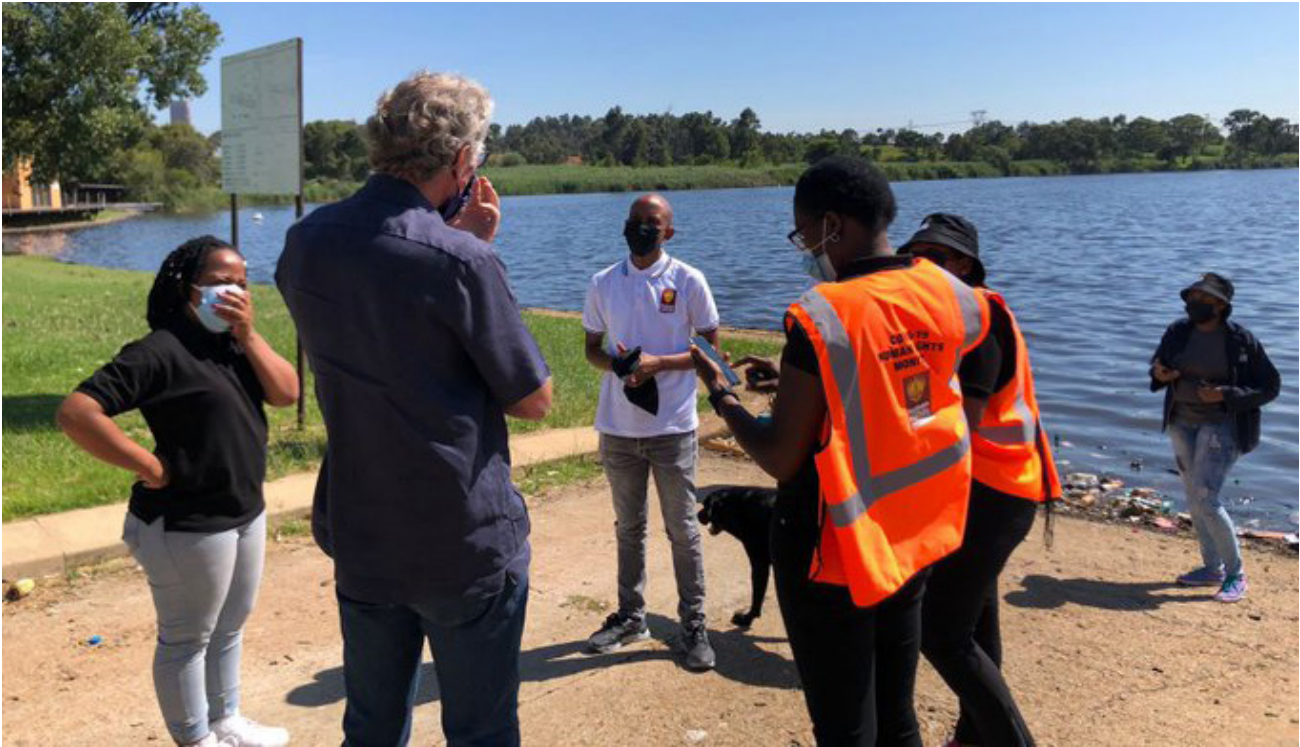
The SAHRC Gauteng Province Office conducting a site inspection at Wammer Pan Lake, in Rosettenville.

The first sitting of the National Investigative Hearing commenced on the November 15, 2021 until December 3, 2021. The second leg of the National Investigative Hearing occurred on February 21, 2022 to March 4, 2022 focusing on events that unfolded in Gauteng Province during the unrest.