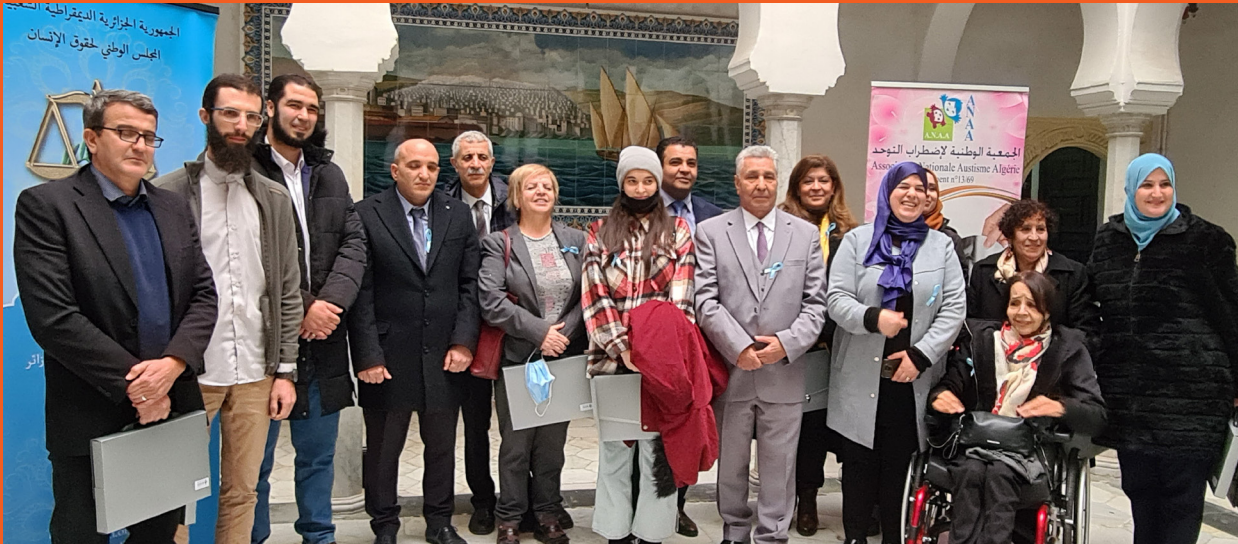
Photo des participants