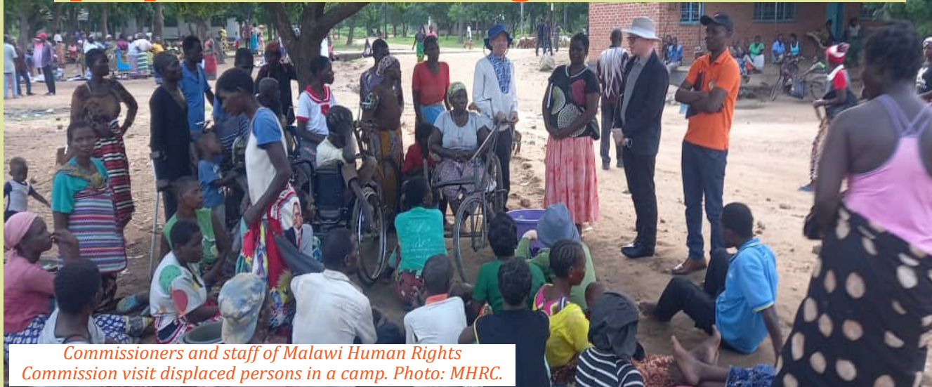
Commissioners and staff of Malawi Human Rights Commission visit displaced persons in a camp.

The effects of Cyclones Ana and Dumako left great devastating effects across the southern part of Malawi displacing over 200,000 households and leaving many others without sources of livelihoods across the 16 districts.