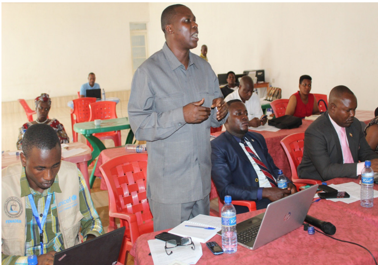
Photos des participants

ont examiné le Burundi à plusieurs reprises. De nouveau, des titulaires de mandats thématiques ont soumis à l'Etat du Burundi des questionnaires à remplir en vue de contribuer au Rapport des rapporteurs spéciaux présenté à la 49ème Session ordinaire du Conseil des droits de l'homme. La participation des acteurs étatiques et non-étatiques s'est avérée incontournable pour contribuer à ces thématiques. Ces thématiques portaient sur : la gestion et l'élimination des substances toxiques comme l'exposition au mercure; liberté de réunion pacifique et d'association; formes contemporaines d'esclavage affectant les minorités; conséquences de la COVID-19 sur l'éducation des filles ; mariage d'enfants; droits des filles et femmes autochtones ; amélioration de la protection des personnes déplacées internes; responsabilité et accès aux recours dans les cas d'abus des droits de l'homme liés aux entreprises.