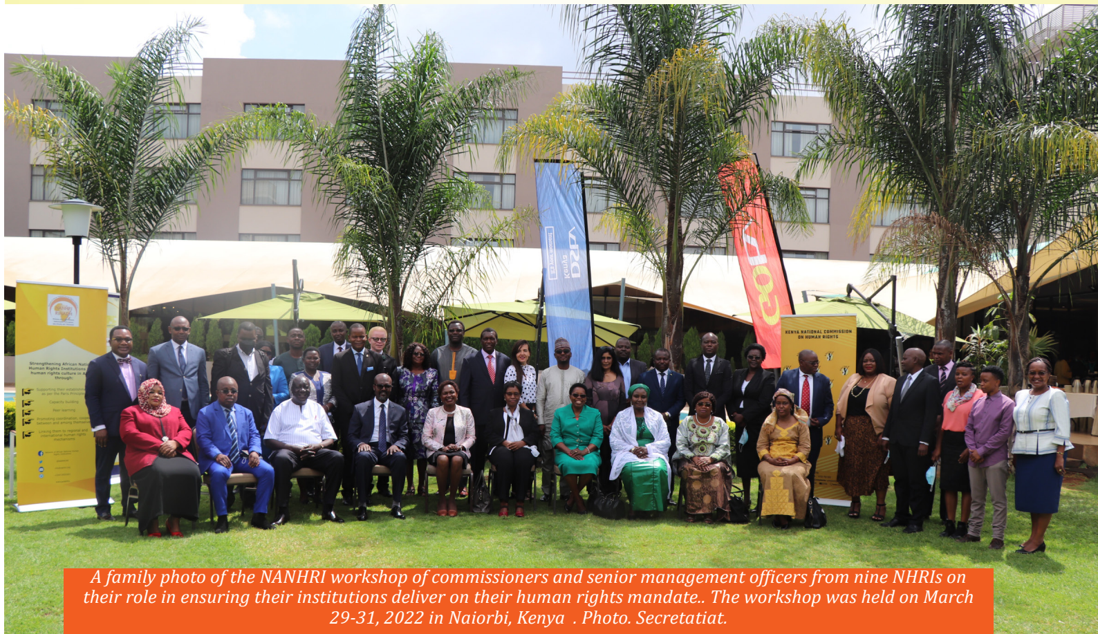
A family photo of the NANHRI workshop of commissioners and senior management officers from nine NHRIs on their role in ensuring their institutions deliver on their human rights mandate.. The workshop was held on March 29-31, 2022 in Nairobi, Kenya .