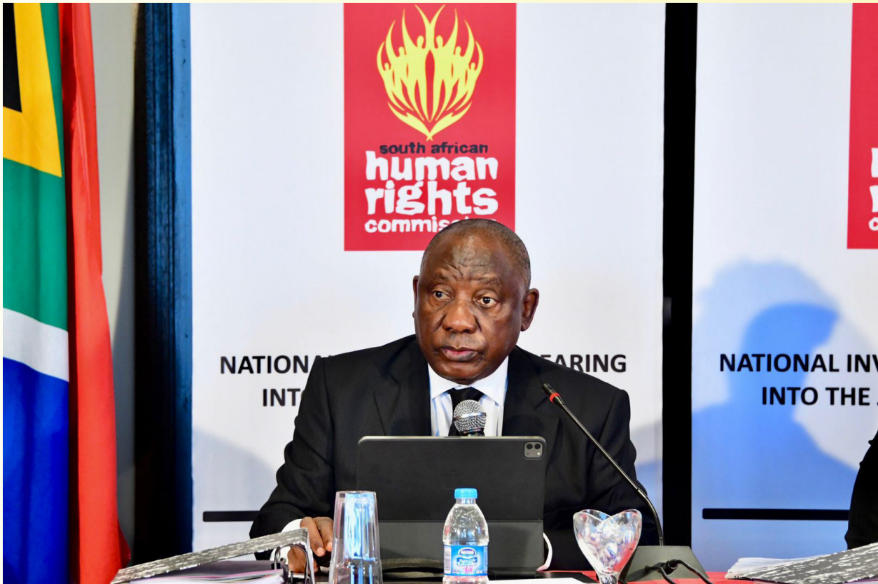
President Cyril Ramaphosa giving testimony at SAHRC July 2021 unrest hearing. By the time of publication of this newsletter, President Ramaphosa had appeared before the SAHRC on April 1, 2022.