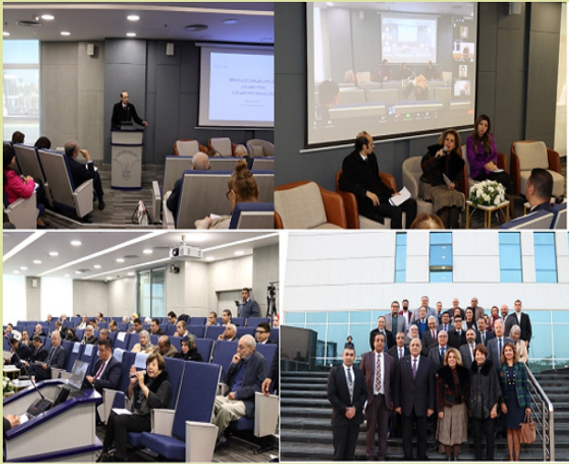
The National Council for Human Rights inaugurates the fifteenth forum of civil society organizations

The National Council for Human Rights NCHR inaugurates the fifteenth forum of civil society organizations The National Council for Human Rights (NCHR) inaugurated on January 17th its fifteenth Annual Civil Society Organisations CSO’s Forum for Human Rights for the year 2023 at the headquarters of NCHR in the presence of Nevin Al-Qabbaj, Minister of Social Solidarity, MP. Tariq Radwan, Chairman of the Human Rights Committee , the House of Representatives, and Dr. Talaat Abdel-Qawi, President of the General Federation of Associations. 2 Ambassador Moushira Khattab, NCHR President, emphasized that the forum is one of the most important events. NCHR has been keen to organize annually since its inception. She hailed the vision of President Abdel Fattah El-Sisi, and his support for the emerging human rights demarch, which requires the solidarity of all state enteties in a real, effective and transparent partnership with civil society organizations that play a pivotal role in dissiinating a culture supportive of human rights, protection, promotion and provision. and monitoring and monitoring implementation. Khattab also stressed the importance of the forum as an opportunity to evaluate the achievements of the year of civil society and build on them and deal seriously and transparently with the challenges.