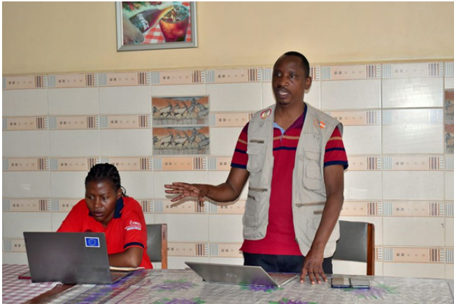
MHRC Officers making a presentation During the Community Engagement Meeting

The Commission with technical and financial support from the Canadian Fund for Local Initiative implemented some activities on raising awareness and advocacy on the minority rights especially rights of the LG-BTQ2I in March 2023. These activities included community engagement meetings, training journalists in positive reporting and a national dialogue. The activities targeted key national and district stakeholders and journalists from both print and electronic media.