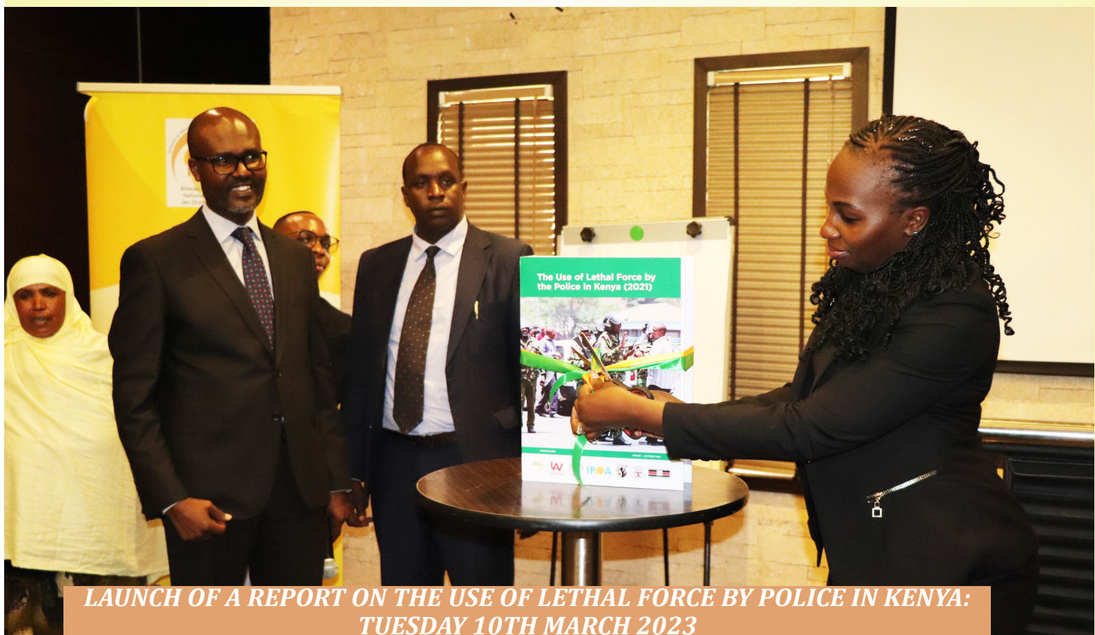
LAUNCH OF A REPORT ON THE USE OF LETHAL FORCE BY POLICE IN KENYA: TUESDAY 10TH MARCH 2023

NANHRI successfully launched a report on the use of lethal force by Police in Kenya on the 10th of March 2023, in Nairobi Kenya. NANHRI undertook a study on the Use of Lethal Force by Police in Kenya for the calendar year 2021. NANHRI conducted a study on the use of lethal force in partnership with the African Policing and Civilian Oversight Forum (APCOF), the Laboratory for the Analysis of Violence of the State University of Rio de Janeiro (LAV), the Kenya National Commission on Human Rights (KNCHR), the Independent Policing Oversight Authority (IPOA) and select CSOs in the country namely the Independent Medico-Legal Unit (IMLU) and the Mathare Social Justice Centre (MSJC). The aim of the study was to analyze systemic factors contributing to the use of lethal force in Kenya, and